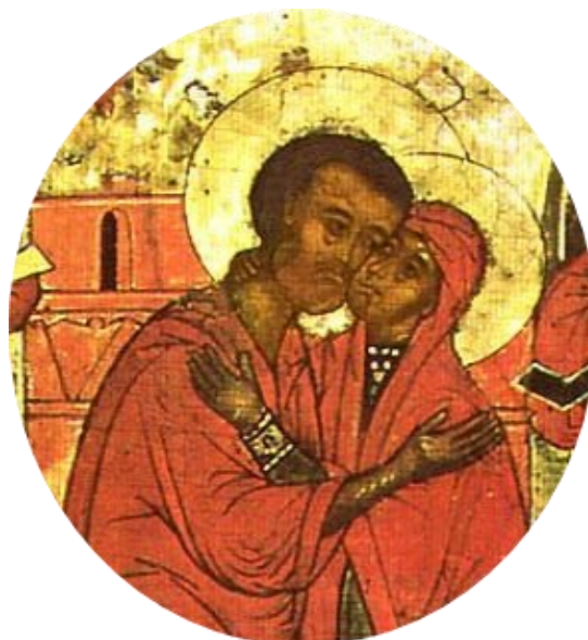
Rencontre de Saint Anne et Saint Joachim

----- * (11 rue Pierre Villey, 75007 Paris)